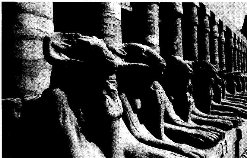
頭が牡羊、体がライオンの姿をした羊頭スフィンクス。 アメン神殿の第一中庭の列柱。